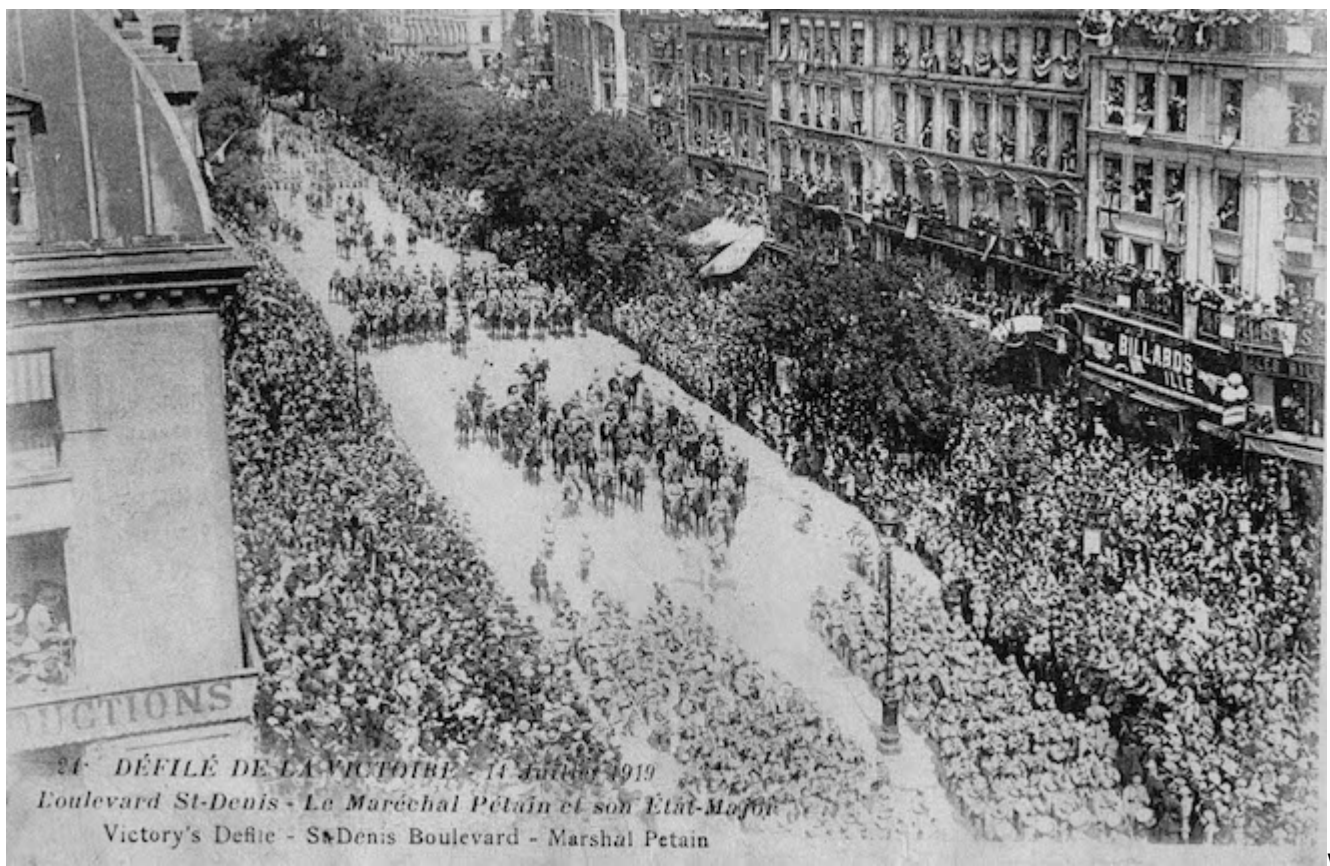
21. DÉFILÉ DE LA VICTOIRE - 14 Juillet 1919 Boulevard St-Denis - Le Maréchal Pétain et son État-Major Victory's Defile - St-Denis Boulevard - Marshal Petain