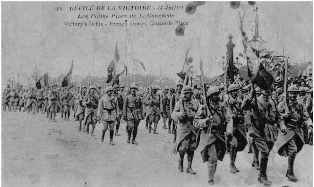
16. DÉFILÉ DE LA VICTOIRE - 14 Juillet 1919 Les Poilus Place de la Concorde Victory's Defile - French troops Concorde Place