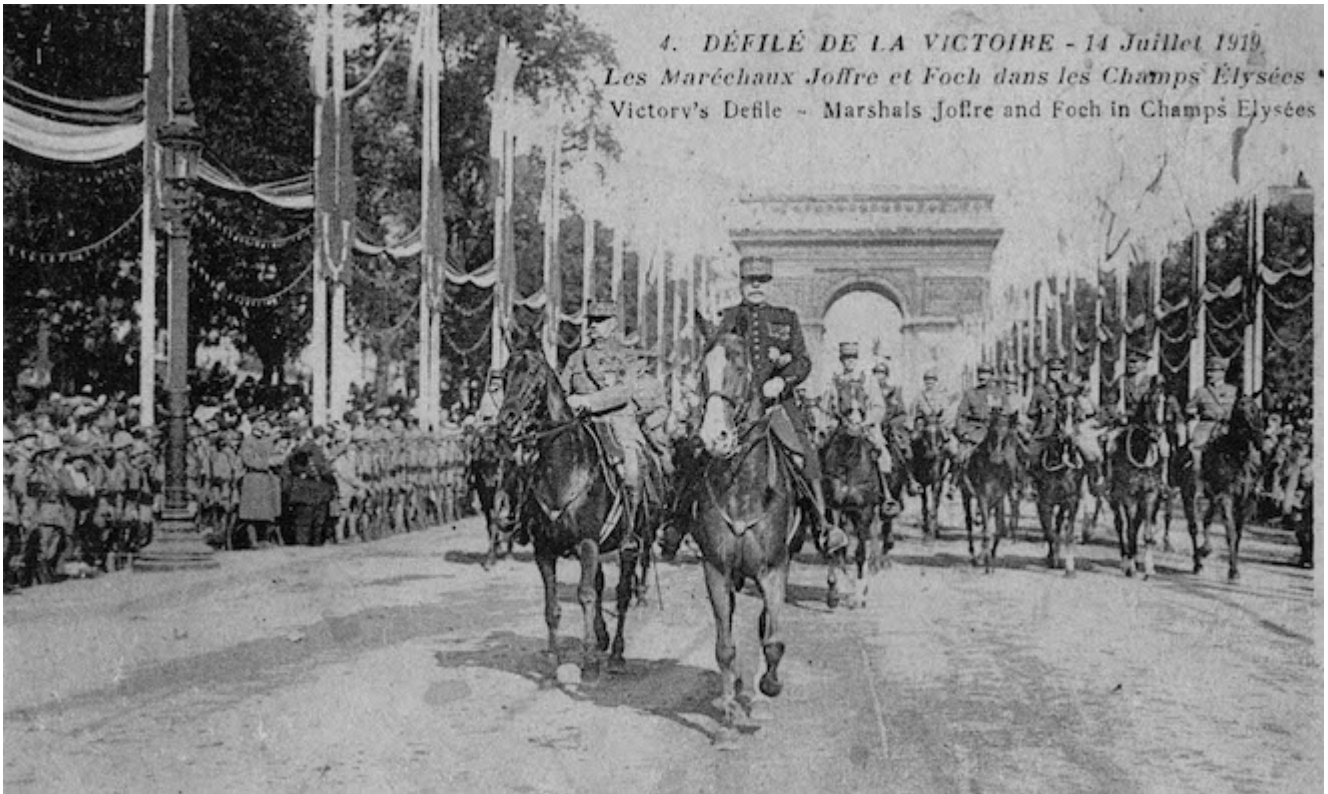
Les Maréchaux Joffre et Foch dans les Champs Élysées Victory's Defile - Marshals Joffre and Foch in Champs Élysées