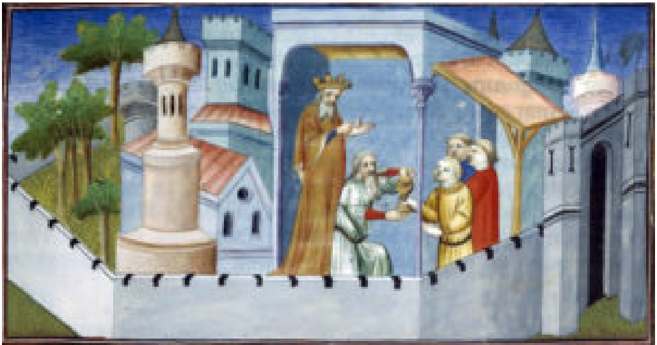
Le Vieux de la Montagne droquant ses disciples avec une boisson à base de haschisch

Marco Polo prétendit lui aussi avoir visité la forteresse d'Alamut, bien qu'elle n'ait probablement été guère plus qu'un tas de ruines à son époque (14ème siècle). Il raconta avoir percé le secret à l'origine de cet engagement hors norme : les disciples d'Hassan ibn al-Sabbah auraient été drogués au haschisch et auraient entrevu le paradis lors d'une mise en scène organisée par la secte. A leur réveil, ils auraient gardé le souvenir d'un jardin paradisiaque où se trouvaient de la nourriture et des femmes en abondance. Dès lors, ils n'auraient eu qu'une idée en tête, retrouver ce paradis et pour cela, il leur suffisait de suivre les ordres du grand maitre jusqu'à la mort.