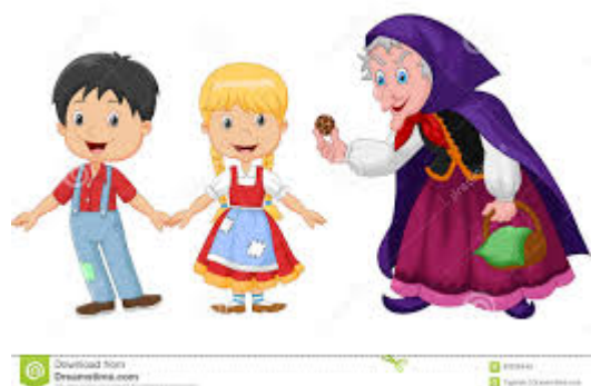
Illustration : Affiche de Hansel et Gretel à l'Opéra de Stuttgart

écrit par Christine Tasin | 4 novembre 2017