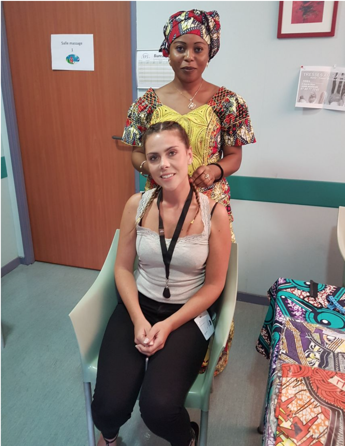
Les donneuses de sang peuvent ressortir de l'EFS de Besançon avec des tresses africaines.

Les donneuses de sang peuvent ressortir de l'EFS de Besançon avec des tresses africaines.