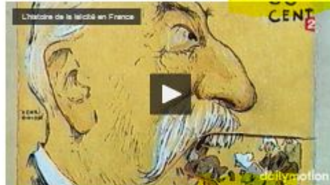
L'histoire de la laïcité en France par francetv/info