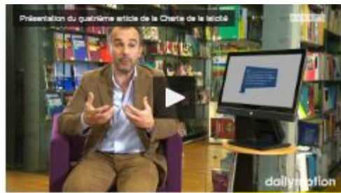
Présentation du quatrième article de la Charte... par EducationFrance