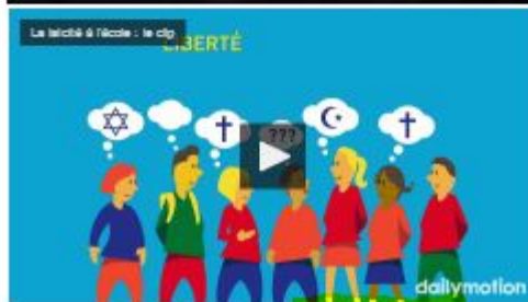
La laïcité à l'école - le clip par EducationFrance