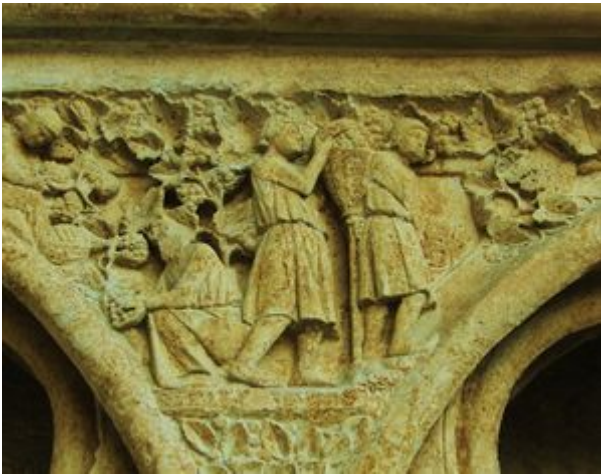
Scène de vendanges, portail de la cathédrale de Bourges